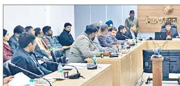
सिरसा। समीक्षा समिति एवं जिला सलाहकार समिति की बैठक लेते एडीसी।

लघु सचिवालय के सभागार में जिला स्तरीय समीक्षा समिति एवं जिला सलाहकार समिति की तिमाही बैठक आयोजित की गई। बैठक में अतिरिक्त उपायुक्त ने जनकल्याणकारी योजनाओं के तहत बैंकों द्वारा वितरित किए जाने वाले ऋण और उनकी लक्ष्य प्राप्ति की समीक्षा की गई। बैठक में बैंकों के