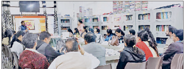
भूना। कार्यशाला में अध्यापकों को प्रशिक्षित करते हुए विशेषज्ञ।