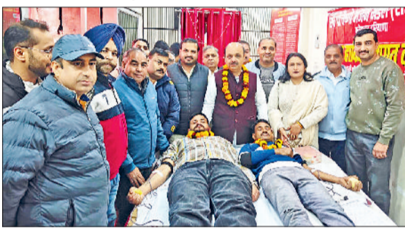
फतेहाबाद। रक्तदाताओं को प्रोत्साहित करते बीजेपी जिलाध्यक्ष व मंडल सदस्य।