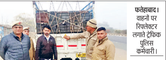
फतेहाबाद। वाहनों पर रिफ्लेक्टर लगाते ट्रैफिक पुलिस कर्मचारी।

धुंध के दौरान होने वाले सड़क हादसों की रोकथाम को लेकर थाना यातायात फतेहाबाद की टीम द्वारा विशेष जागरूकता अभियान चलाया गया। इस अभियान के दौरान ट्रैफिक पुलिस ने टाटा एस सहित अन्य छोटे व्यावसायिक वाहनों के चालकों को धुंध के समय वाहन चलाने हुए आवश्यक सावधानियों के बारे में विस्तार से अवगत करवाया। साथ ही सुरक्षा